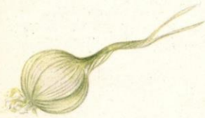
cinco dientes ajo