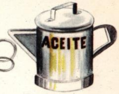
200 gramos aceite